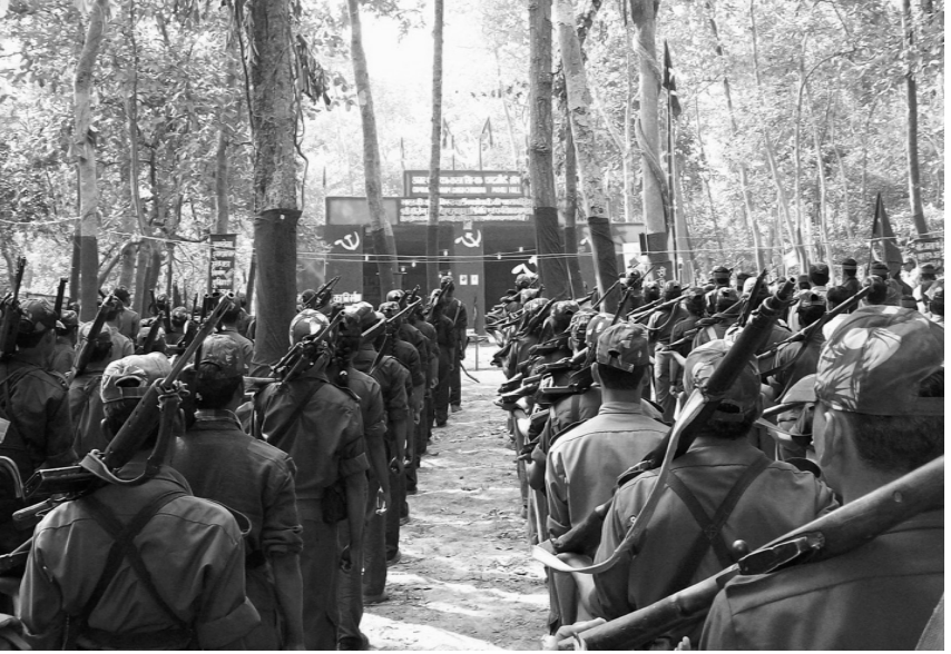
මහජන විමුක්ති හමුදාවේ සහෝදරවරු සිරුවෙත්

හැමිබර්ග් ශ්‍රේෂ්ඨ ජාත්‍යන්තර සම්මේලනය සහ සහයෝගය දැක්වීමේ ජාත්‍යන්තර කමිටුව සංවිධානය කළ ජාත්‍යන්තර දින ක්‍රියාකාරකම් ඇතුළු විවිධ ජාත්‍යන්තර මූලපිරීම් සහ ප්‍රයත්නයන් ඉන්දියානු ජනතාව සමග සහයෝගය ගොඩ නැගූ අතර ඔවුන්ගේ විමුක්තිය සඳහා වූ අරගලයට සහය ලබා දුන්හ. මේ මූලපිරීම්